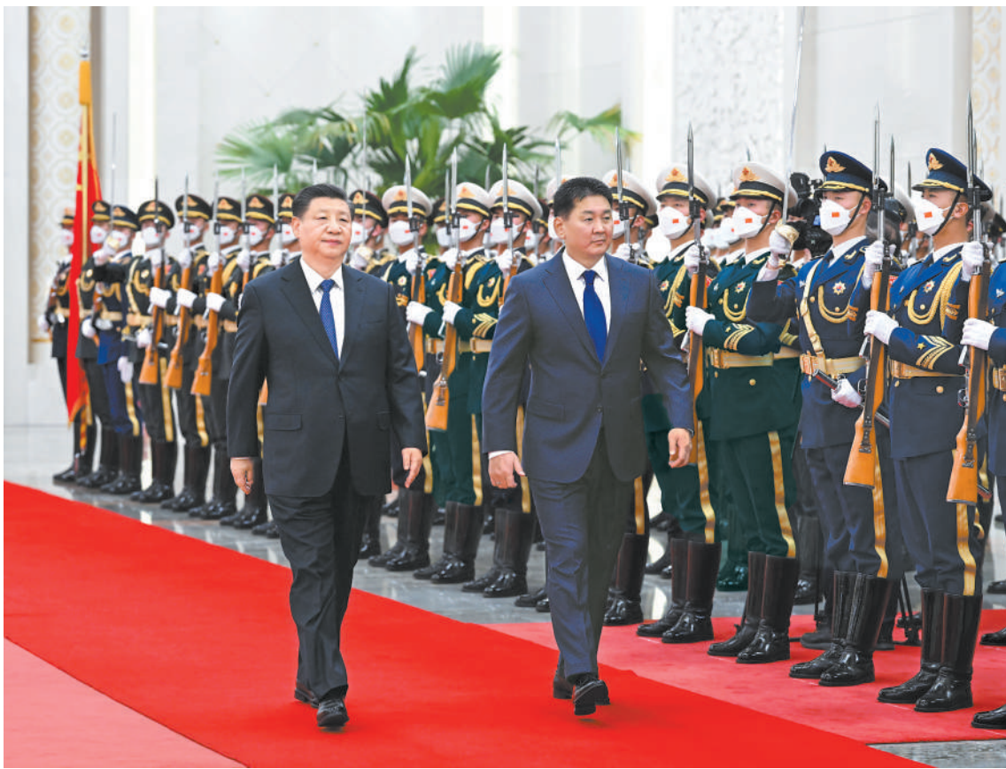
十一月二十八日,国家主席习近平在北京人民大会堂同来华进行国事访问的蒙古国总统呼日勒苏赫举行会谈。这是会谈前,习近平在人民大会堂北大厅为呼日勒苏赫举行欢迎仪式。

新华社北京11月28日电 11月28日下午,国家主席习近平在人民大会堂同来华进行国事访问的蒙古国总统呼日勒苏赫举行会谈。