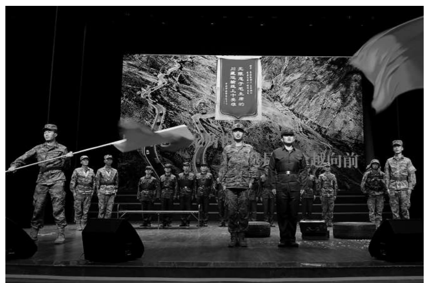
情景剧《穿越时空的对话》。

“我曾跨越过山和大海,也穿过人山人海……”伴随着吉他弹唱《平凡之路》,强军故事会落下帷幕。官兵表示,一次活动就如一场动员,典型事迹催人奋进,立起了爱军精武样板,激发大家岗位建功热情。