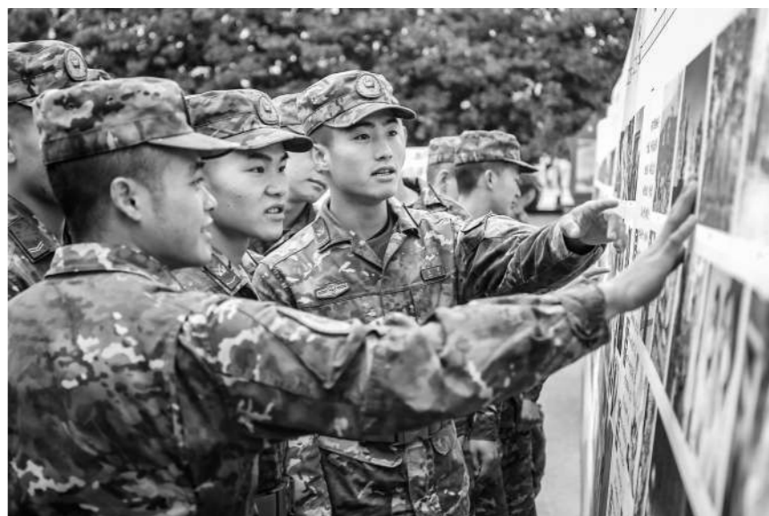
近日，武警贵州总队机动支队举办主题摄影展，面向全支队官兵征集近年来展现强军足迹、部队发展以及自我成长的摄影作品，讴歌党领导下的人民军队在新时代取得的成就。

如今，该旅区分军衔级别，根据考核情况、任职实绩等，为每名军士建立评估档案，在此基础上结合个人意愿、综合素质和发展潜力等遴选出“苗子”，纳入旅“高级军士苗子库”。单位对这些“好苗子”在学习培训、资质认定、任务锤炼等方面给予大力支持，助力其提高晋升高级军士的竞争力。近年来，该旅已有几十人加入高级军士队伍，多人被任命为军士参谋、干事和助理员。