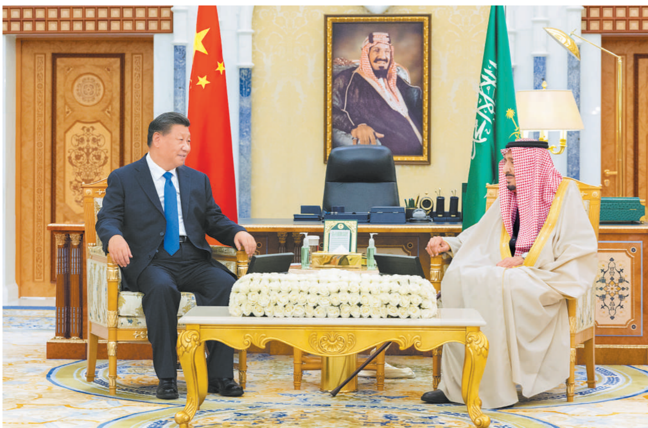
当地时间12月8日下午,国家主席习近平在利雅得王宫会见沙特国王萨勒曼。