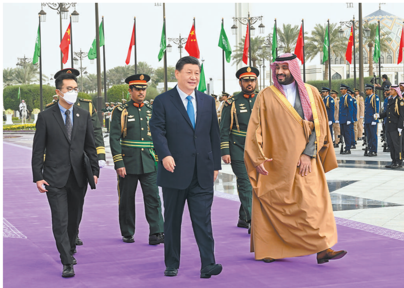
当地时间12月8日中午,沙特王储兼首相穆罕默德代表国王萨勒曼为正在沙特进行国事访问的国家主席习近平在利雅得王宫举行欢迎仪式。