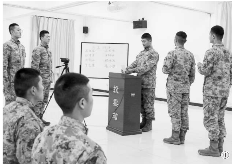
图①:近日,第82集团军某旅组织“双争”评比时,风气监督员全程监督,确保评选公平公正。

喜讯传出,该旅许多在外执行任务的官兵备受鼓舞,工作训练更有劲头。大家说,今后要积极参与大项任务,在任务历练中提高素质、争当先进。