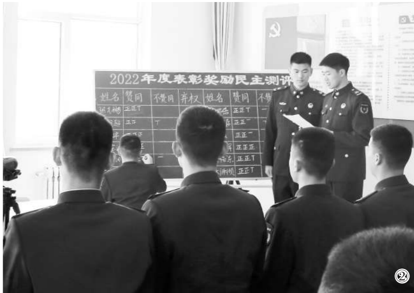
图②:12月初,宁夏军区某部依法组织“双争”活动。图为官兵正在民主测评。