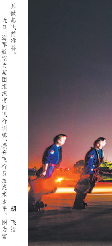
兵做起飞前准备。近日,海军航空兵某团组织夜间飞行训练,提升飞行员技战术水平。

随着训练深入推进,该支队专业力量遂行任务能力稳步提升,多次在大项任务中表现突出。据介绍,该支队被武警部队评为“军事训练一级支队”,多名官兵在上级组织的比武中取得优异成绩,多人被评为“优秀指挥员”“标兵教练员”。