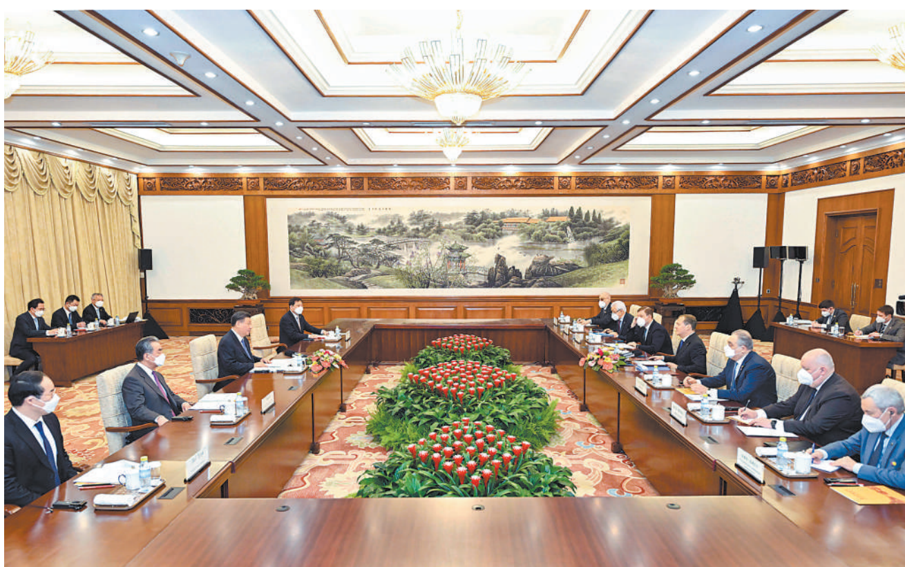
12月21日,中共中央总书记、国家主席习近平在北京钓鱼台国宾馆会见应中国共产党邀请访华的俄罗斯统一俄罗斯党主席梅德韦杰夫。

新华社北京12月21日电 12月21日,中共中央总书记、国家主席习近平在钓鱼台国宾馆会见应中国共产党邀请访华的俄罗斯统一俄罗斯党主席梅德韦杰夫。 习近平请梅德韦杰夫转达对普京总统的亲切问候和良好祝愿,指出中共二十大明确了全面建成社会主义现代化强国、以中国式现代化全面推进中华民族伟大复兴的中心任务。我们有充足底气、坚定信心走好中国式现代化之路,也为世界和平与繁荣提供更多机遇。中国共产党和统一俄罗斯党长期开展机制化交往,成为巩固中俄政治互信、推进两国互利合作、展现两国战略协作的独特渠道和平台,为新时代中俄关系行稳致远提供了有力支撑。当前,中俄执政党交往迈入“第三个10年”。希望两党继续围绕治国理政经验、促进发展战略对接、推动政党国际多边合作等深入交流,就执政党建设互学互鉴,为深化中俄全面战略协作贡献智慧和力量。 习近平指出,过去10年,中俄关系经受住国际风云变幻的考验,始终健康稳定高水平发展。中俄发展新时代全面战略协作伙伴关系,是双方基于各自国情作出的长远战略选择。中方愿同俄方一道,把新时代中俄关系不断推向前进,共同推动全球治理朝着更加公正合理的方向发展。 习近平表示,在乌克兰危机问题上,中方一贯按照事情本身的是非曲直决定自己的立场和政策,秉持客观公正立场,积极劝和促谈。希望有关各方保持理性克制,开展全面对话,通过政治方式解决安全领域共同关切。 梅德韦杰夫首先转交普京总统致习近平主席的亲笔信,转达普京对习近平的友好问候和美好祝愿。梅德韦杰夫热烈祝贺习近平再次当选中共中央总书记,祝贺中共二十大取得一系列重大成果,表示中国共产党领导中国取得更大发展不仅造福14亿中国人民,对整个世界也意义重大,相信中共二十大作出的决策部署将得到有效落实。统一俄罗斯党与中国共产党的合作是俄中两国关系的重要组成部分。近年来两党关系保持高水平发展,双方开展了广泛交流合作。统一俄罗斯党愿同中国共产党加强治国理政经验交流,落实好两国元首首脑达成的共识,积极推进两国经贸、能源、农业等领域合作,共同抵制外部施加的各种压力和不正当措施,推动俄中全面战略协作伙伴关系实现更大发展。乌克兰危机事出有因,十分复杂,俄罗斯愿意通过和谈解决面临的问题。 双方还就共同关心的其它国际地区问题交换意见。 王毅等参加会见。