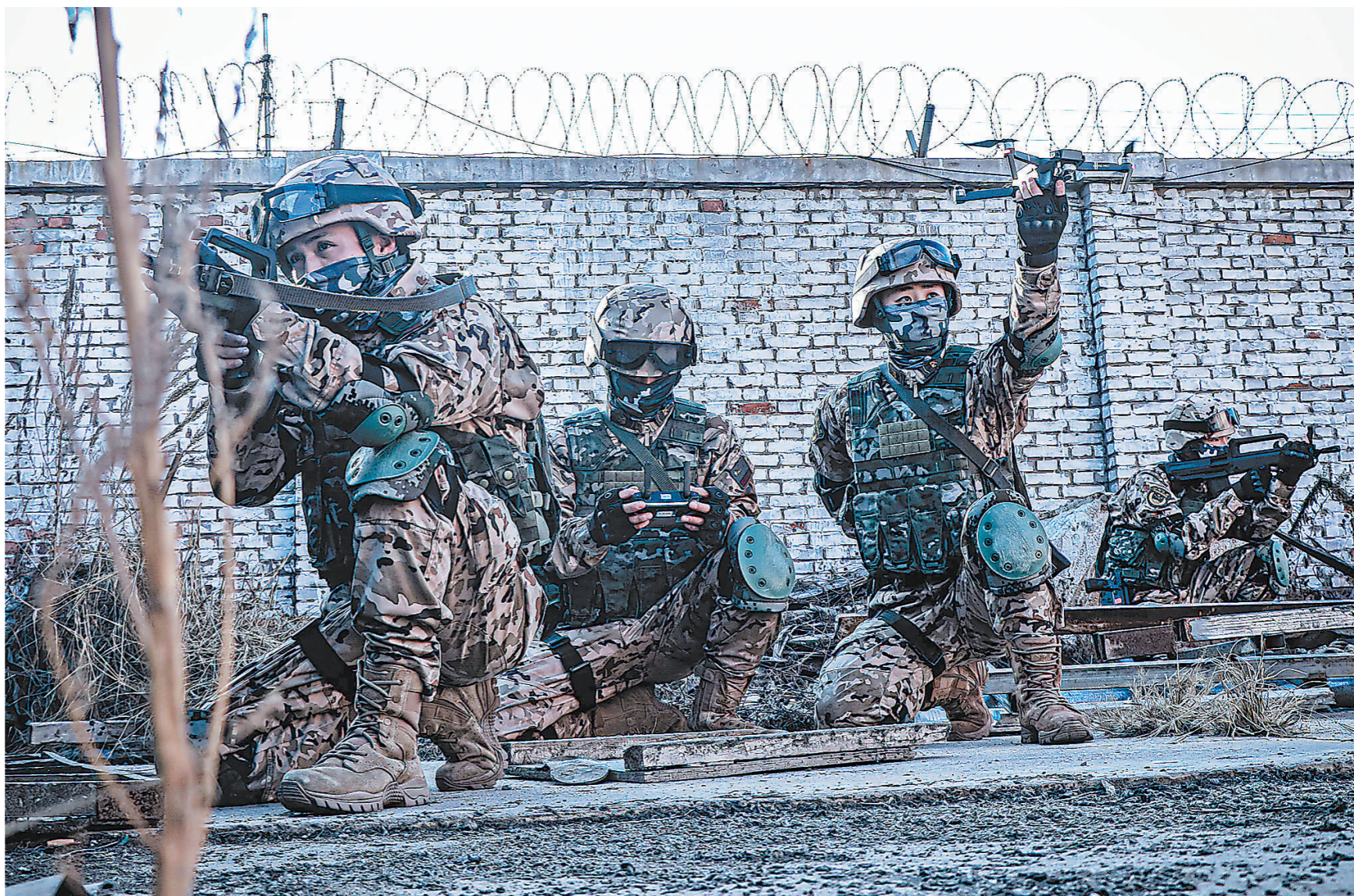
12月9日,武警天津总队机动支队开展侦察行动综合演练,检验提升官兵综合作战能力。图为侦察队员准备实施空中侦察。