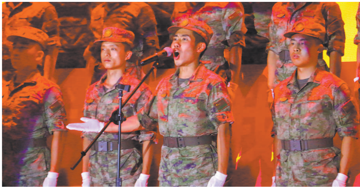
演唱与合唱《前进,强大的战略支援部队》。