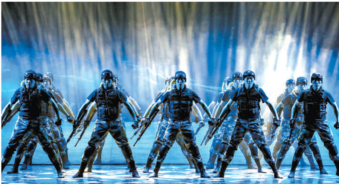
男子群舞《超越》。