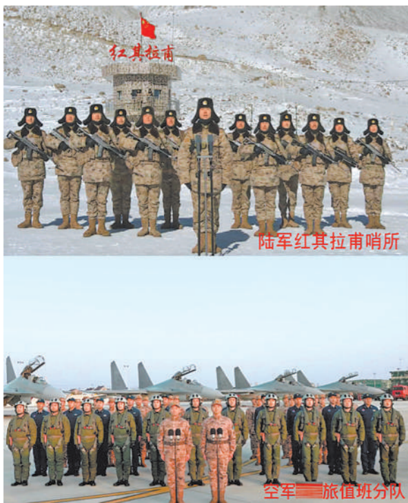
陆军红其拉甫哨所