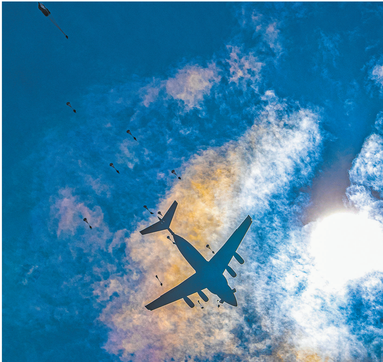
3月31日，空降兵某旅组织集群伞降训练。

官兵利益无小事，暖心举措润兵心。因常年担负教学演训保障任务，该校区部分官兵面临“调休难”问题。为此，他们采取分批次组织、分岗位轮换等办法，确保官兵应休尽休。得到充分休整的官兵返岗后，以更加饱满的精神状态投入训练，出色完成多项重大任务。