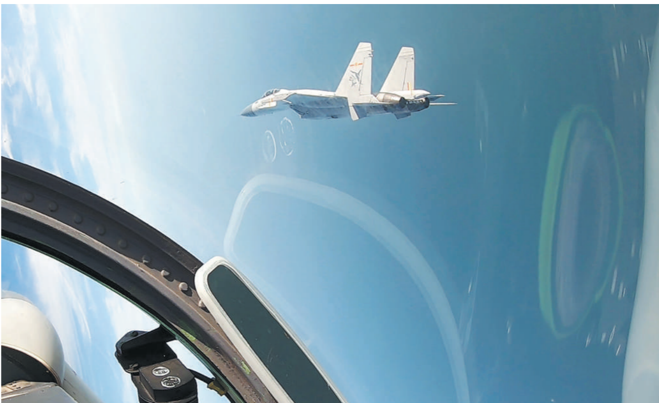
飞行员驾机进行空战对抗。