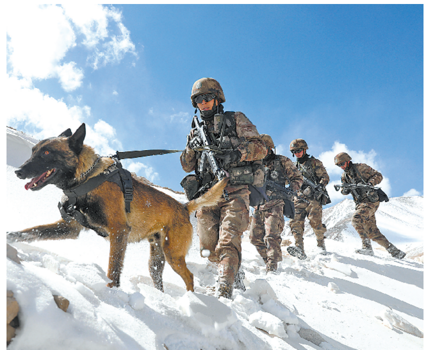
3月4日,新疆喀什军分区某边防团塔合曼边防连官兵路雪巡边,确保边境辖区安全稳定。

“大连市军地联合下发首批基层武装部规范化建设达标单位通报,让41个达标单位的经验做法通过媒体广泛宣传被更多的人知晓,也让后进单位倍感压力。”大连军分区领导介绍,12个存在问题的武装部领导按照通报要求逐条逐项对照检查。庄河市兰店乡召开常委会,将武装部规范化建设作为第一项议题,一班人积极建言献策,查短板、补弱项。全市本次没有参评的96个乡镇(街道),也纷纷按照要求制订了全年工作落实计划。