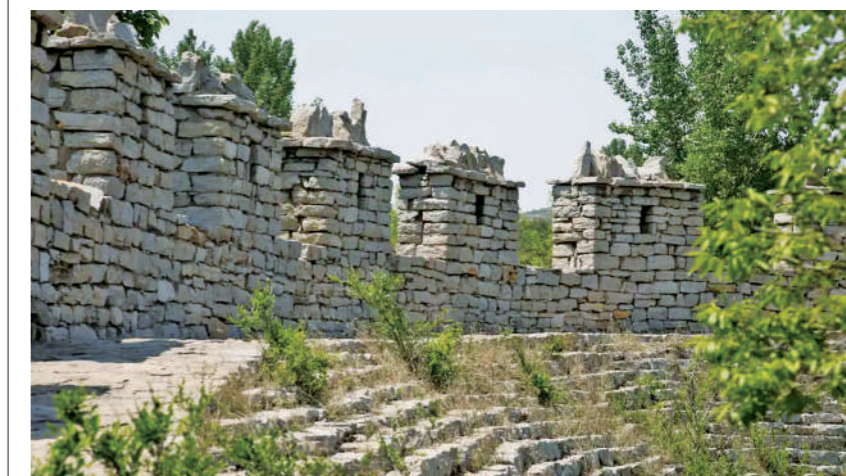
位于山东省济南市境内的齐长城遗址。

齐长城始建于春秋时期,完成于战国时期,是齐国为防备其他诸侯国进攻而修筑的防御工事。它建筑在起伏连绵的泰沂山脉的山岭、平谷之中,西起平阴县境内,向东经淄博、沂水、莒县等县市,向东至青岛黄岛区入海,东西蜿蜒600多公里。齐长城作为中国现存有准确遗迹可考、保存状况较好、年代最早的古代长城,凝聚着2500年前我国劳动人民的勤劳与智慧,也体现了春秋首霸和战国七雄的齐国的强国风貌。1987年,齐长城作为中国长城的一部分,被联合国教科文组织列入《世界文化遗产名录》。