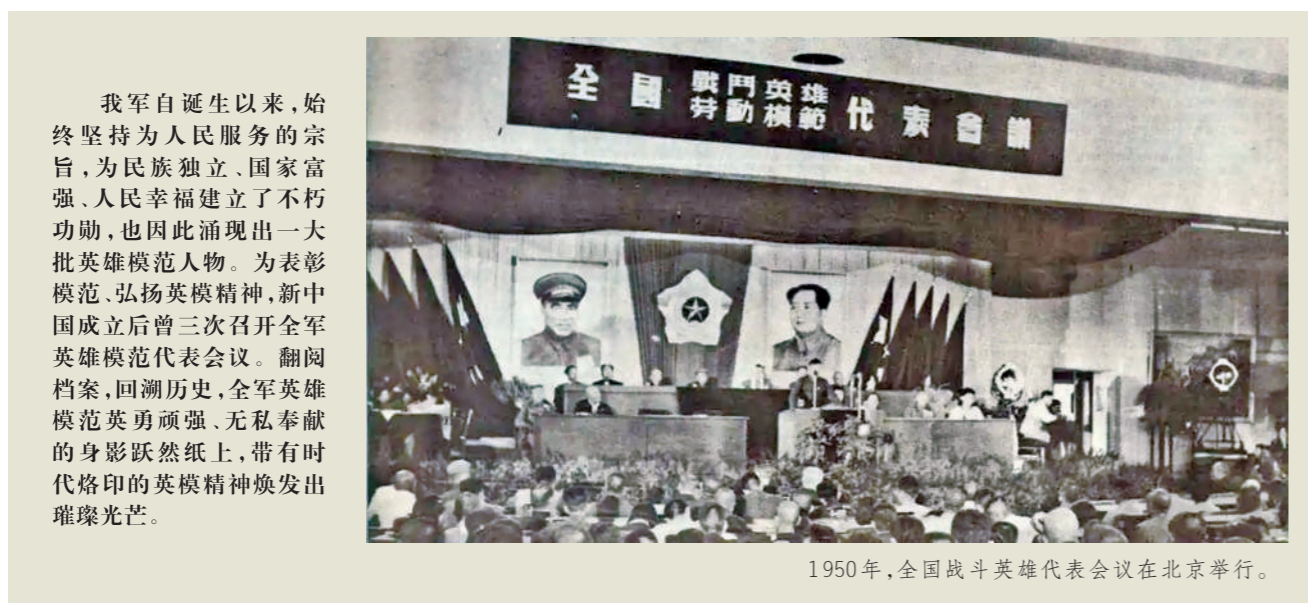
1950年,全国战斗英雄代表会议在北京举行。