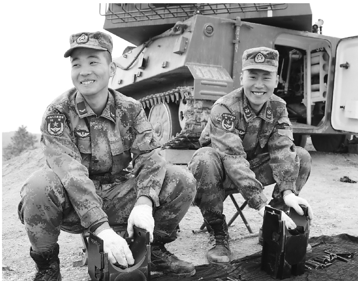
寒风凛冽,第77集团军某旅一营官兵自办趣味运动大赛提升练兵热情——