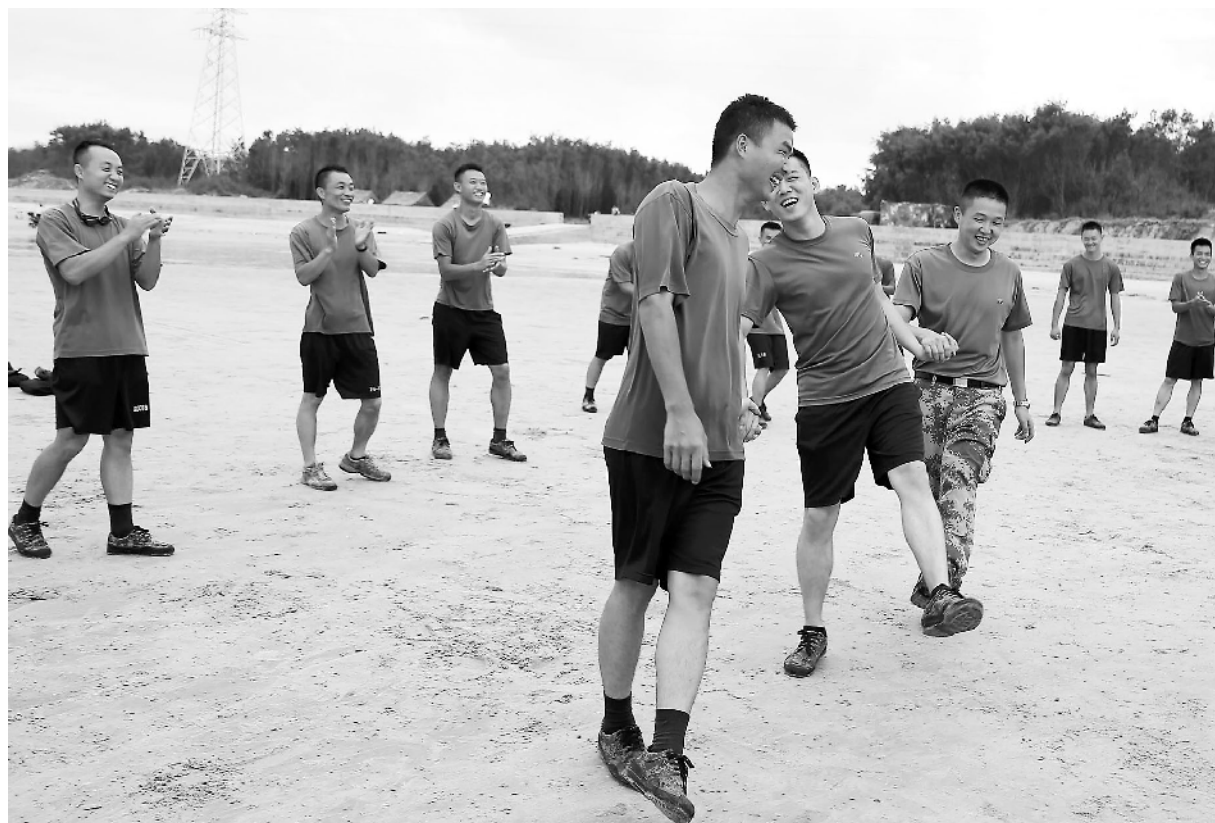
7月13日，第73集团军某勤务支援旅在海训期间开展丰富多样的文体活动，调动官兵训练热情。图为训练间隙3名文体骨干现场发挥，为大家带来一场没有经过排练的“军营版海草舞”，动作不算整齐却照样嗨翻全场。