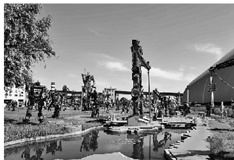
近年来,河北省着力化解钢铁过剩产能,推动创新发展、绿色发展、高质量发展。图为一家钢厂利用拆除旧生产车间的空地,打造绿色景观。