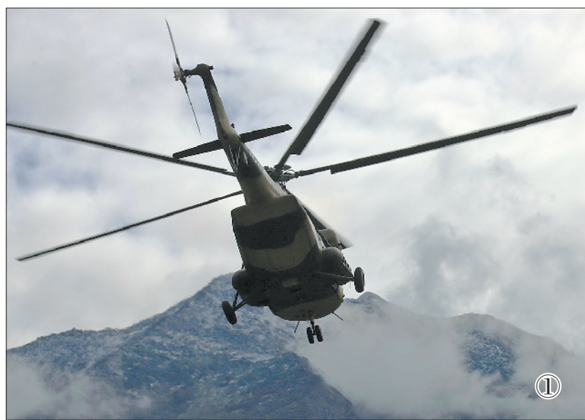
图①：边防连官兵搭乘直升机飞往大山深处的哨所。 图②：官兵们激动地跃出机舱，奔向哨所。 图③：军犬和战士们一起飞往哨所，执行巡逻任务。 图④：直升机圆满完成运输任务，官兵们向飞行员挥手告别。 图⑤：官兵们深情地注视着五星红旗冉冉升起，心中充满豪情。

运送官兵进驻哨所后，直升机还将在崇山峻岭上空飞行，对边境线进行空中巡逻。而留在哨所的边防官兵，将骑马在边境地区展开到点到位的巡逻行动。