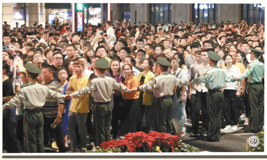
图1：国庆节期间，南京路上武警官兵用“人墙”疏导客流，守护节日平安。 图2：“浦江光影秀”期间，武警官兵坚守在外滩执勤一线。 图3：客流高峰期，武警官兵手牵手建起“人墙”，引导游客有序通过。