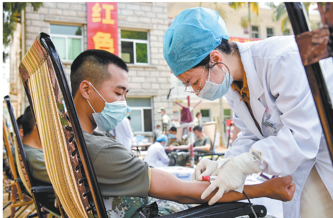
4月18日，第73集团军某旅与驻地血站联合开展无偿献血活动，258名官兵共献血9万多毫升。图为医护人员为官兵抽血。

“周、月、季工作一环扣一环，每一环都关乎年度‘双争’评比的排名，这样就有效规避了‘印象分’和‘人情分’影响，使‘黑马’很难出现了。”团政委樊江伟说，这种常态用力、量化评比、综合评定的“双争”评比手段实施后，官兵不争平时争平时，谁先进谁后进大家心里有杆秤，各单位自主抓建、奋勇争先的劲头更足了。