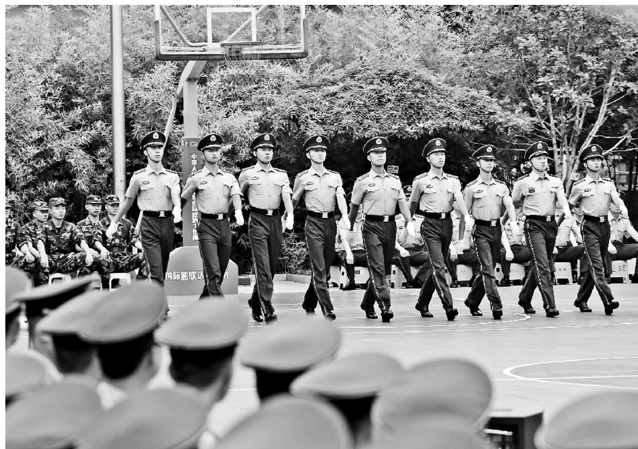
近日,武警北京总队执勤第一支队组织官兵进行队列会操,强化官兵作风养成,增强条令意识。

近日,该旅在组织警示教育时,让违规违纪人员现身说法,讲清网络赌博和网上借贷的陷阱与套路,剖析误入歧途的原因和教训。旅机关干部张干事说,身边案例最有说服力,能直观提醒大家网上有风险,要始终保持警醒。