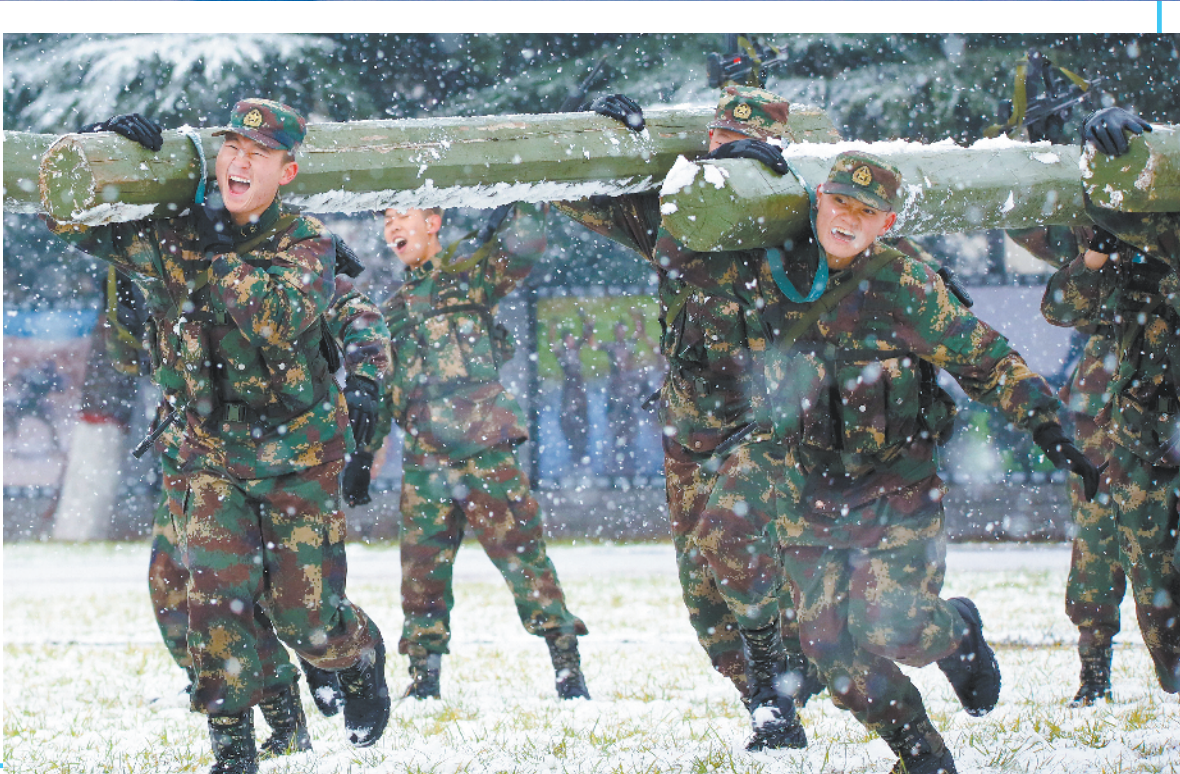
右图：寒冬，火箭军某部组织开展冬季练兵活动，锤炼官兵战斗意志。