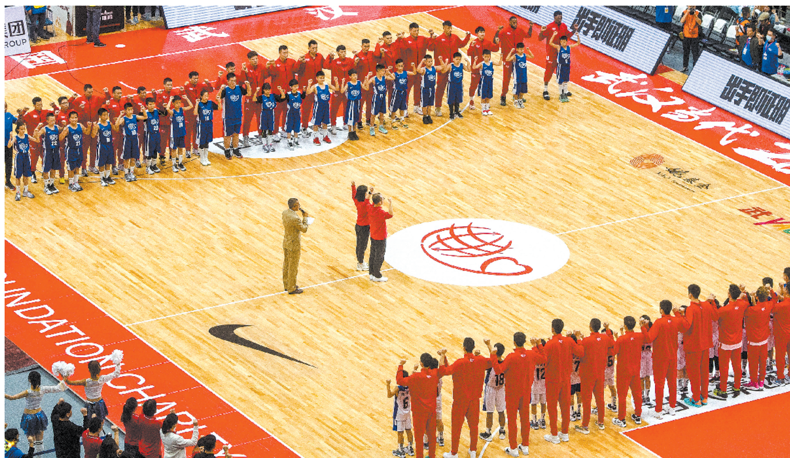
10月4日,曾作为方舱医院的武汉体育中心恢复对外开放。图为在此举行的姚基金慈善赛赛前,双方球员向抗击疫情的武汉人民、英雄之城武汉致敬。