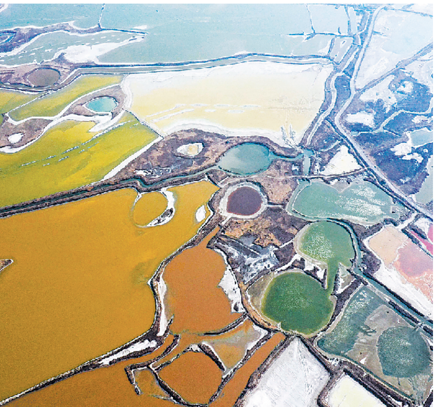
近日，随着气温逐渐回升，山西运城盐池呈现五彩斑斓的景象，美不胜收。

间等高危作业现场安全管理。 会议要求，要精准执法检查抓防控，抓住最不放心的、最薄弱地区、最有可能发生事故的领域和企业不松手，逐一明确检查人员，落实检查任务措施；对节日期间企业负责人擅自离岗、重大风险不及时处置的一律停产整顿；强化应急值班值守，各级领导干部尤其是主要领导既要在岗在位更要查铺查哨，严格执行节日期间信息报告和外出报备等制度。 会议强调，要转变工作作风抓防控，对发现的重点难点问题、重大风险隐患，切实加强整改落实，不排除风险隐患不撒手，决不能因节日因素就有所放松。