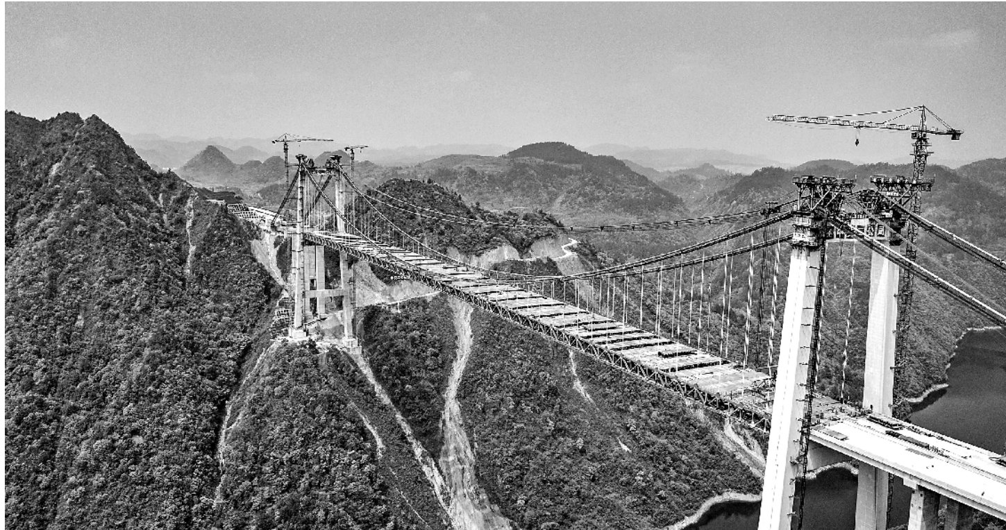
3月27日，位于贵州省贵定县的阳宝山特大桥主桥顺利合龙。阳宝山特大桥是贵黄高速公路控制性工程。项目建成通车后，对改善少数民族地区公路交通网络结构、推动沿线资源开发具有重要意义。

准确把握新发展阶段、深入贯彻新发展理念、加快构建新发展格局，才能确保“十四五”开好局起好步。如何聚焦“三新”主线读懂“十四五”规划纲要，“三新”如何体现并落实于经济社会发展各领域？我们邀请了国务院发展研究中心研究员张立群进行解读。