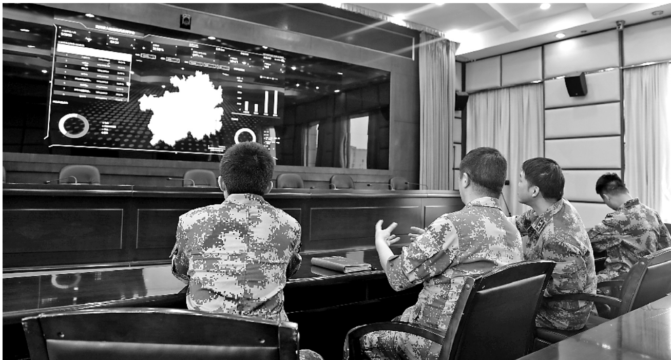
贵州省征兵办与贵阳市征兵办工作人员依托“大数据征兵应用平台”复盘总结春季征兵工作。